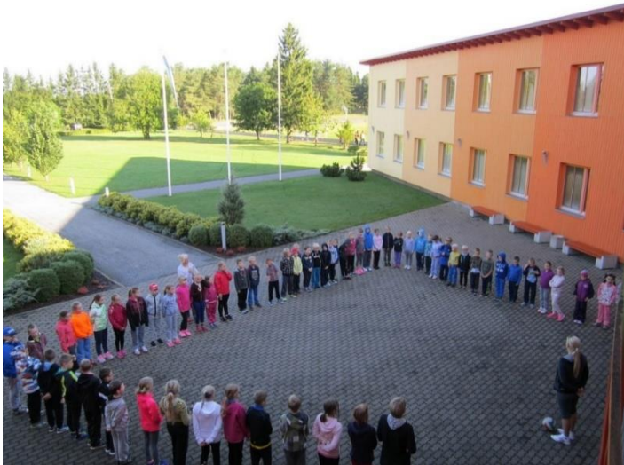
Joonis 1. Näide korrektselt lisatud joonisest.

Tabelid ja joonised paigutatakse tekstireale ja joondatakse vasakule. Suuremahuline fotomaterjal või joonised lisatakse tööle lisana ja nendele viidatakse töö sisus.